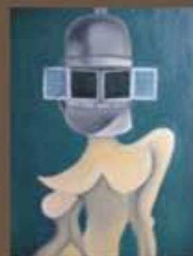
Peintures d'Emmanuel PAJOT